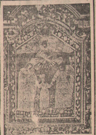
CUDOWNY OBRAZ ŚW. JÓZEFA w Kolegiacie Kaliskiej

Złóż ofiarę na odbudowę KATEDRY POZNAŃSKIEJ P. K. O. V-5454.