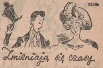
Zmieniają się Crasy