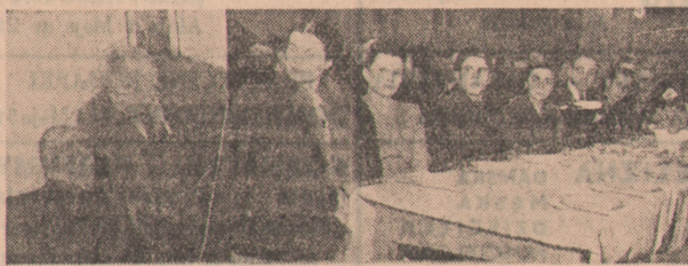
Jak już donosiliśmy, w ub. sobotę zakończony został kurs handlowy dla kupców, zorganizowany przez Izbę Przemysłowo-Handlową wspólnie ze Zrzeszeniem Kupców Samodzielnych.