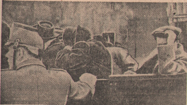
Na placu Poczdamskim, w radzieckiej strefie Berlina, policja niemiecka przeprowadziła niespodziewanie obławę na czarnogieldziarzy, którzy tam właśnie wybrali sobie miejsce dla załatwiania swych nielegalnych transakcji. W czasie obławy skonfiskowano znaczne ilości złota, srebra, dewiz, papierosów i prawdziwej kawy. Ujęci przez policję czarnogieldziarze zasłaniają swe twarze przed obiektywem fotoreportera.