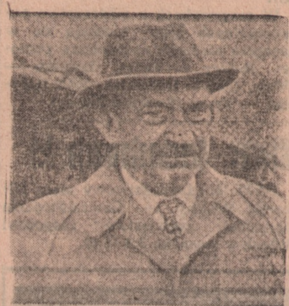
Dr Weizmann kandydat na prezydenta niepodległego państwa żydowskiego.

narodowej". Naród żydowski ma więc poza sobą 30 lat ciężkiej, nierównej walki z imperializmem angielskim — nie tylko walki zbrojnej, ale i wielkiej, podziwu godnej pracy pionierskiej na ziemiach swoich historycznych, pracy ukoronowanej wzniesieniem wspaniałego, nowoczesnego miasta Tel-Aviv — obok wielu innych nowoczesnych osad, zwłaszcza wiejskich o wysokiej kulturze rolnej. Przemysł i handel, oświata, nauka i sztuka również osiągnęły wysoki poziom.