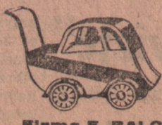
Firma F. BALCERKIEWICZ i Ska

FABRYKA KONFEKCJI WĘSKIEJ I CHŁOPIĘCEJ BRACIA LISIECCY POZNAŃ, Stary Rynek 72 tel. 2517 - 1097 Polecamy na sezon jesienno-zimowy palta, kurtki, garnitury, spodnie i ubranka chłopięce