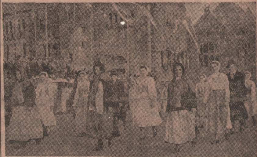
Grupa Wielkopolan w strojach regionalnych w pochodzie.