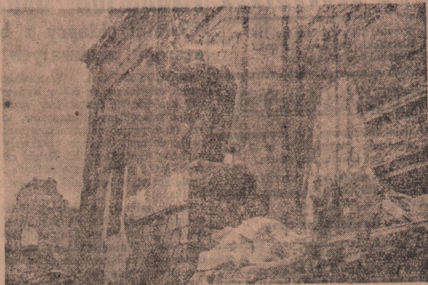
Kościół św. Krzyża.

Nic to, że Marszałkowska składa się tylko z parterów, że powyżej