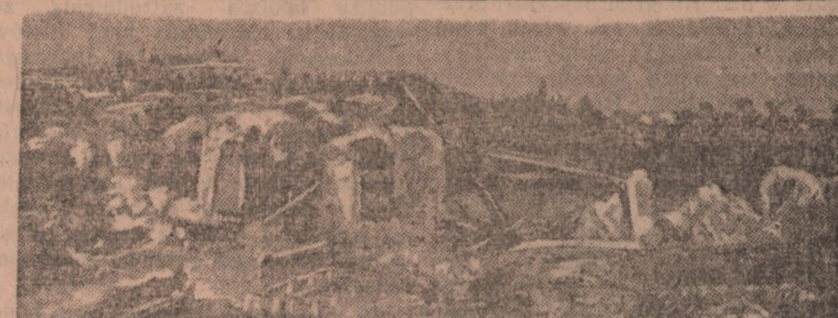
Na linii Chłust-Empol zniszczony w czasie wojny wiadukt...