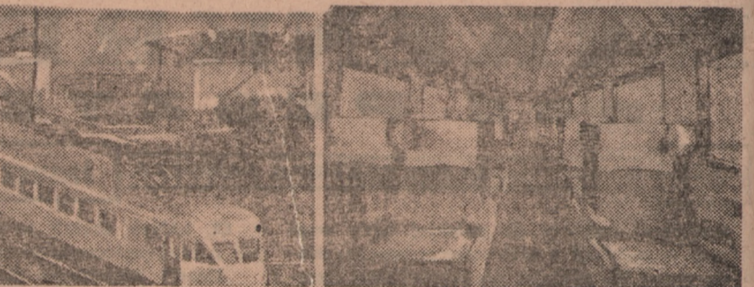
Na głównych liniach włoskich kursują już pociągi elektryczne doskonale wyposażone. Siedzą na tych wygodnych fotelach można podróżować bez zmęczenia

szanse zdobycia pierwszej nagrody, co przy moim przysłówowym szczęściu było murowane. Zdobylem jednak wspomnianą broszurę, bardzo bogato nota bene ilustrowaną. W kilku artykułach przedstawiono tam czytelnikowi w sposób przystępny i nie nużący bilans strat kolejnictwa włoskiego, dotychczasowe wyniki odbudowy, plany na przyszłość oraz osiągnięcia i ulepszenia techniczne.