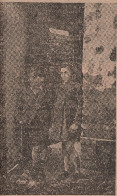
Niepewną jest także przyszłość dzieci bezrobotnych angielskich górników czy robotników, zamieszkujących dotknięte wojną powiaty Wielkiej Brytanii

Przemysł węglowy Wielkiej Brytanii przechodził kryzys nie notowany dotąd w historii. Rząd brytyjski przewidział skutki na rok przed katastrofą. Wiedział, że zapasy wydobywanego węgla nie pokryją zapotrzebowania w kraju. Był jednak bez-