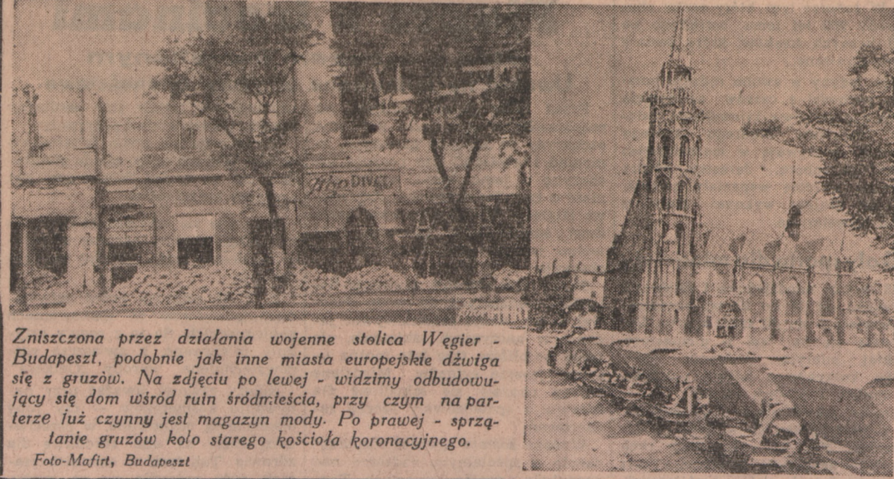
Zniszczona przez działania wojenne stolica Węgier - Budapeszt, podobnie jak inne miasta europejskie dźwiga się z gruzów. Na zdjęciu po lewej - widzimy odbudowujący się dom wśród ruin śródmieścia, przy czym na parterze już czynny jest magazyn mody. Po prawej - sprzątanie gruzów koło starego kościoła koronacyjnego.