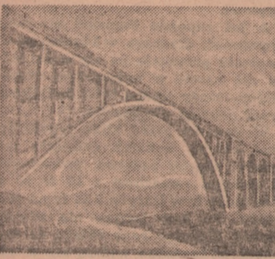
..a tak przedstawia się prospekt nowego wiaduktu