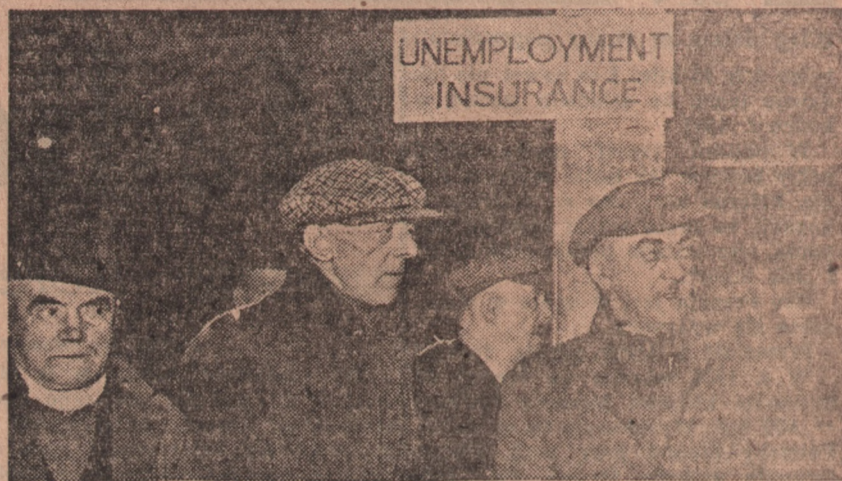
Głęboki smutek maluje się na twarzach skazanych na bezczynność Anglików

cie ekonomiczne powojennej Anglii nie wniosło żadnych udogodnień. Przeciwie, oba kraje zaczęły na nowo rywalizować o palmę pierwszeństwa w dziedzinie handlu i wpływów w krajach poza własnym kontynentem. Handel ten okazał się dla Ameryki konieczny, celem utrzymania zdrowej gospodarki, dla Anglii zaś jest on zagadnieniem ważniejszym, bo decydującym o życiu lub śmierci.