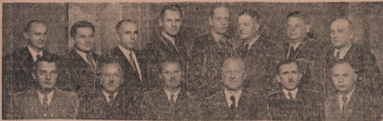
Zarząd Zrzeszenia Kupców Polsko-Chrześcijańskich w Inowrocławiu

ZJEDNOCZENIE ENERGETYCZNE OKRĘGU POMORSKIEGO.