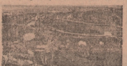
...Niemcy zniszczyli go całkowicie...

nę 6) ledwie już dyszący pociąg z równie ledwie dyszącymi pasażerami wtoczył się na dworzec rzymski zgodnie z rozkładem jazdy, wywołując tą swoją punktualnością u dyżurnego ruchu najpierw przerażenie, a potem dziecięcy podziw. Moje uprzedzenie do Ferrovie Italiane dello