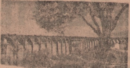
Tak wyglądał przed wojną atut okolo 700 metrów wiadukt kolejowy w płd. Włozzech...

Gdy wieczorem wsładałem w Mediolanie do pociągu, mającego mnie zawieźć do Rzymu, przeklinałem w duchu zły los, który zmusił mnie do odbycia tak fantastycznej podróży, mogącej moim zdaniem stanowić przyjemność jedynie dla indyjskich fakirów. Pamiętałem bowiem jeszcze dobrze moją pierwszą podróż na tej linii w październiku 1945 r., kiedy to po 33 godzinach jazdy (przed woj-