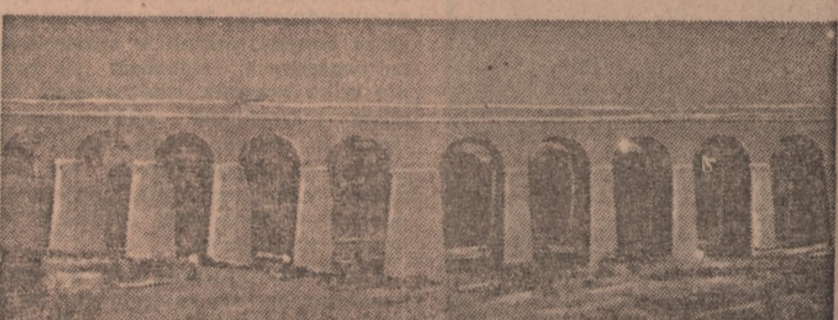
...został już całkowicie odbudowany

szanse zdobycia pierwszej nagrody, co przy moim przysłówowym szczęściu było murowane. Zdobylem jednak wspomnianą broszurę, bardzo bogato nota bene ilustrowaną. W kilku artykułach przedstawiono tam czytelnikowi w sposób przystępny i nie nużący bilans strat kolejnictwa włoskiego, dotychczasowe wyniki odbudowy, plany na przyszłość oraz osiągnięcia i ulepszenia techniczne.