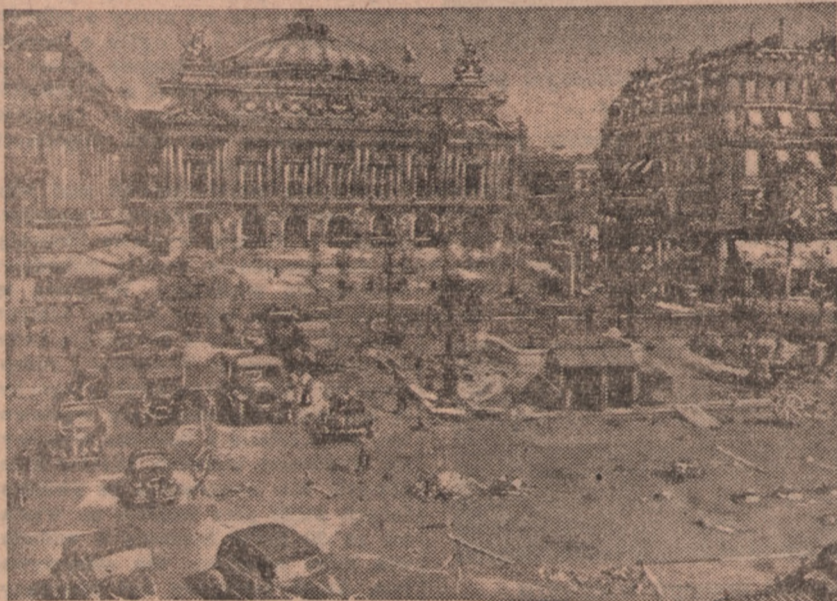
Paryż w miesiącach letnich wyludnił się i ulice świecą pustkami. Korzystając z tego, Zarząd Miejski przeprowadza wiele remontów w stolicy. Na zdjęciu plac opery, na którym na miejsce drewnianej kostki kładzie się asfalt betonowy.