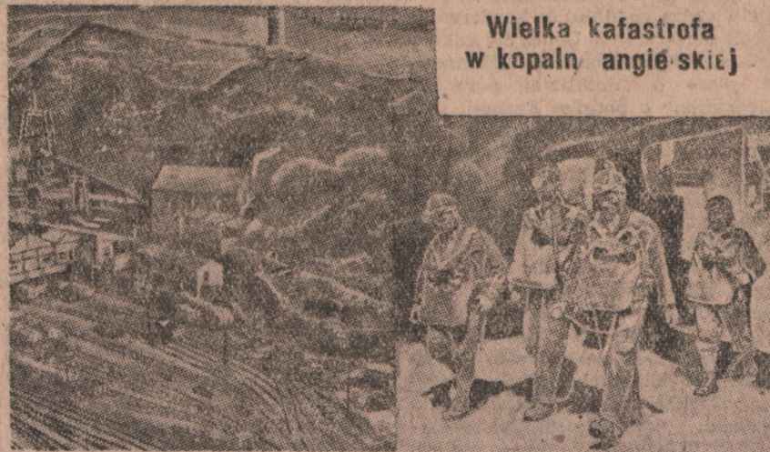
Wielka kastrofa w kopalni angielskiej

Do posiadłości francuskich w Indiach należą Pondicherry na wschodnim wybrzeżu Indii i Chandernahore w pobliżu Kalkuty.