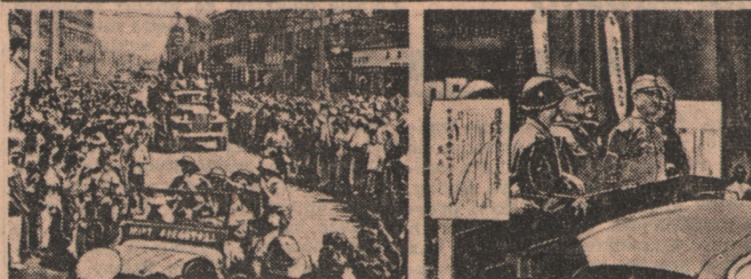
Japońscy zbrodniarze wojenni na plac egzekucji jadą w asyście wojska amerykańskiego. Tłumy mieszkańców wyległy na ulice aby ostatni raz zobaczyć tych, którzy winni są nieszczęściom gniejącym kraj. Na placu egzekucyjnym, ustawiono za nimi symboliczne miecze do ścinania głów.

KAIR. Jak donosi z Kairu agencja France Presse, do brytyjskiej kwatery głównej na Środkowym Wschodzie nad Kanalem Sueskim przybył marszałek Montgomery. Ma on zbadać zagrożenie bezpieczeństwa Palestyny i sprawę redukcji brytyjskich sił zbrojnych na Środkowym Wschodzie.