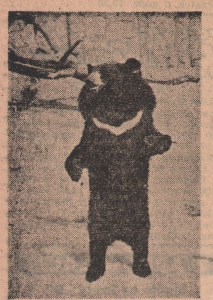
Niedźwiedź Puczi na widok jabłek staje na dwóch łapach.

(Ciąg dalszy ze str. 4-tej) stwo utrzymać przy życiu. Mała lama, która urodziła się kilka mie-