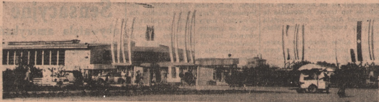
Widok ogólny na część Gdyniąską M. T. G.