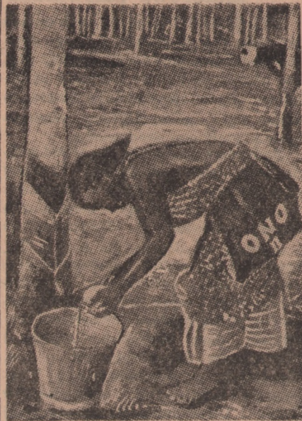
Malajka, stała mieszkanka wyspy Pulo Penang wylewa do wiadra drogocenne mleko kauczukowe zbierające się w porcelanowych naczyniach przyczepionych do drzew.

określić przeznaczenia tych świątyń mimo, że opowiadają o nich fantazyjne baśnie. Jak wiemy, zwierzęta odegrały kiedyś w życiu Chińczyków ogromną rolę. I cały szereg uczo-