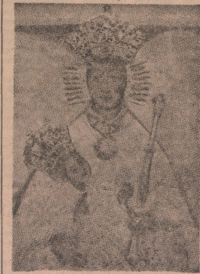
Matka Boska Byszewska

Tradycja podaje, że obraz wyłowiono z jeziora, leżącego tuż obok kościoła noszącego po dziś dzień nazwę „Jezioro Święte”. Ks. Kujot twierdzi, że przez Byszewę od Wyszogrodu na Bydgoszcz do Sepólna i Tucholi prowadził gościeńiec. W Byszewie, przy jeziorze Świętym prawdopodobnie była stacja postojowa przy niej studzienka, a przy studzience mała Boża Męka z obrazem Matki Boskiej. Tutaj podróżni zatrzymywali się, pojąc znużone konie i modląc się do Matki Boskiej by im była Opiekunką w dalszej podróży. Krzyżacy pod wodzą Michała Kochmeistera ponosząc klęskę w 3 miesiące po bitwie grunwaldzkiej wsi Łącko, niedaleko Byszewy obraz ten potajemnie zabrali, lecz jakim szczególnym trafem powrócił on do Byszewy — niewiadomo. Fakt ten może w pewnym stopniu wyjaśnić powstanie legendy o wyłowieniu obrazu z jeziora. Parafianie, zapewne schowai-