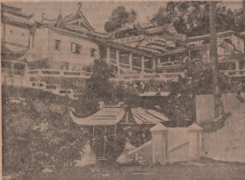
Najpiękniejszy zabytek wyspy — świątynia „czarnej wody”.

Pozostałe karty uczestnictwa wydają oraz wszelkich informacji w sprawie Narady udziela sekretariat Zarządu Woj. SP, Bydgoszcz, Jagiellońska 2, tel. 23-87. Uczestnikom Narady przybywającym koleją spoza Bydgoszczy udzieli potrzebnych informacji służba informacyjna Stronnictwa Pracy, czynna w hallu Dworca Głównego w Bydgoszczy od soboty 5 bm. popołudniu. Znak rozpoznawczy służby informacyjnej — opaski biało-czerwone z napisem SP.