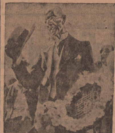
Po raz pierwszy od 1939 r. szwedzki król Gustaw, liczący lat 88, wybiera się na francuską Rivierę, by brać udział w rozgrywkach tenisowych w Monte Carlo