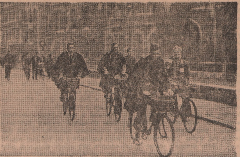
Studentów na rowerach zdążają na wykłady

Oxford dzisiejszy jest kuźnią wiedzy praktycznej.