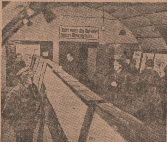
Procesy denazyfikacyjne odbywają się nie tylko w Niemczech. Zrzucić z siebie niewygodne dziś piétno „nazi” można także w Anglii. Oto pawilon propagandy denazyfikacyjnej w obozie Radwinter, w księstwie Essex. Nad wejściem widnieje napis następującej treści: „Każdy musi posiadać odwagę wypowiedzenia własnego zdania”