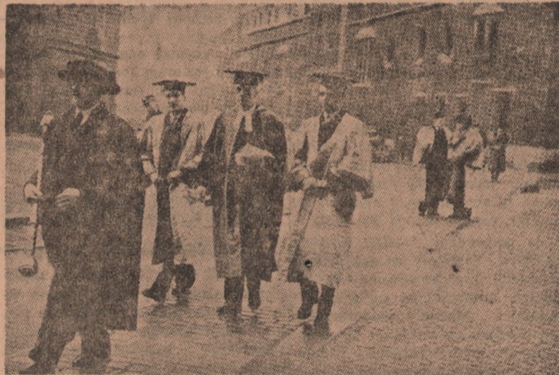
Wicerektor z dr Williamem Walton i dr Malcolmem Sargent, którzy otrzymali honorowe tytuły w Oxfordzie

Koło, w marcu Ostatnia wojna zamieniła tak dalece strukturę socjalnego i intelektualnego życia uniwersytetu oxfordzkiego, że już nigdy nie odzyska on swego dawnego charakteru. Proces przemiany nie skończył się z chwilą uzyskania zwycięstwa. Mija drugi rok pokoju, a przed Oxfordem stają coraz to nowe problemy, dla których rozwiązania musi on zrzekać się coraz więcej znamiennych cech swego przedwojennego sposobu życia.