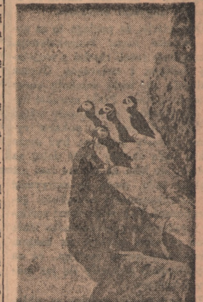
Płaki północny zastanawiają się, czy nie będą zmuszone przedsięwziąć wędrówki jeszcze dalej w okolice polarna.

Jako pierwszy zaobserwował te zmiany norweski badacz stref polarnych — Svanerup. Nie wierzył on swoim własnym oczom, kiedy raz pewnego zauważył w jednej z dolin górskich północnego Szpicbergu rosnący samotnie modrak.