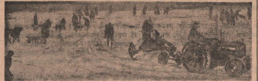
Ani mros, ani śnieg czy dotkliwy brak węgla nie przeszkadza Anglikom w rozgrywaniu meczów piłkarskich. Jeżeli boisko zasypie śnieg, to się je natychmiast oczyszcza przy pomocy traktorów i pługów śnieżnych tań, aby mecz odbył się punktualnie i aby zwolennicy piłki nożnej nie zostali zawiedzeni.