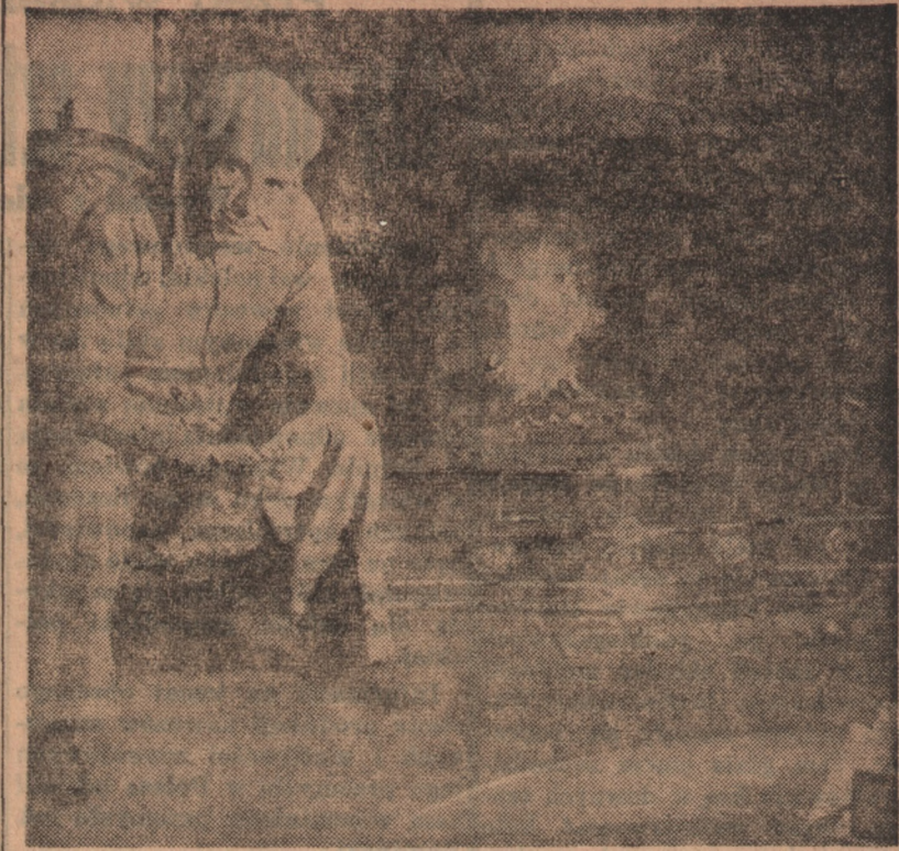
Charles Chaplin w swoim domu w Beverly Hills

O swoich pierwszych latach pobytu w Ameryce, gdzie występował