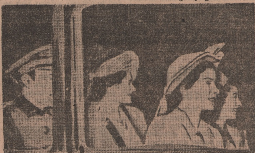
Po raz pierwszy w dziejach Wielkiej Brytanii rodzina królewska odwiedza Południową Afrykę. Po raz pierwszy też obie księżniczki opuściły wyspy brytyjskie.