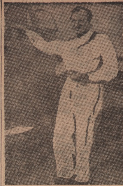
Konkurent Donaldsona, tragicznie zmarły lotnik angielski Haviland.

Tymczasem jedną z największych przeszkód w rozwijaniu większej szybkości zdaje się być powietrze. Wskazują na to wyniki badań, prowadzonych w związku z katastrofą lotnika Havilanda, który na „Latającym skrzydle“ rozbił się nad Tamią. Rzeczoznawcy wykluczają możliwość, aby motor samolotu mógł doznać uszkodzeń w czasie lotu. Tak