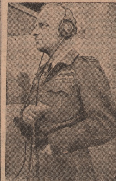
Najszybszy lotnik świata kpt. Donaldson.

Pierwszy rekord szybkości bowiem ustalili zaledwie 40 lat temu, w 1906