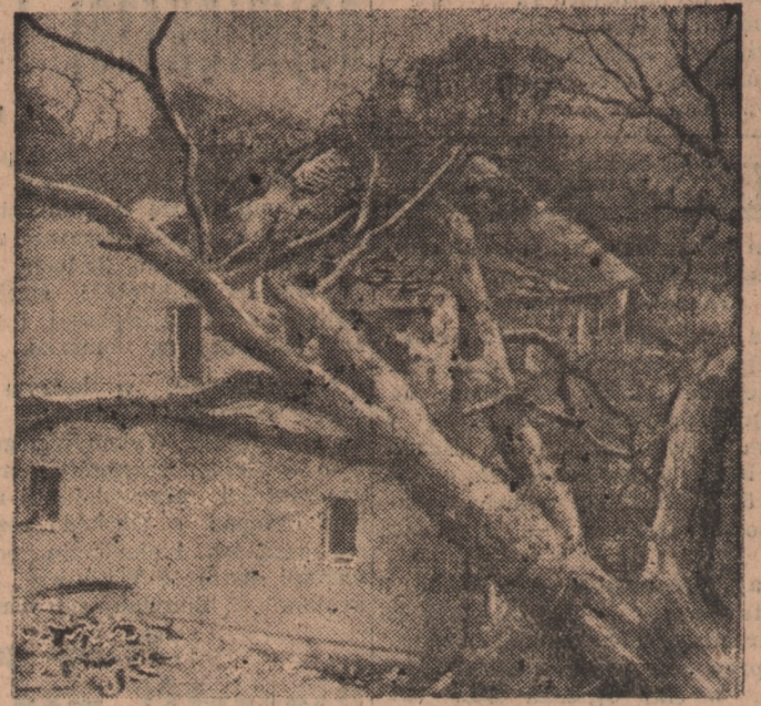
Jeszcze jedno zdjęcie z huraganu, jaki przeszedł nad południową Anglią. W Plymouth orkan wyrucił drzewo, które ciężarem swoim zdruzgotowało nowowypięcony dom, do którego miała się właśnie wprowadzić jedna z bezdomnych rodzin angielskich. Nieszczęśliwi biedacy zmuszeni są nadal cierpliwie czekać na locum.

danych scen. Jednak w końcu książki dodaje, że niepotrzebne mu były argumentacje przygodnie poznanego księdza. Nim skończył swój bolesny stage, dowiedział się, że jest Bóg. Przekonało go nie apostołstwo słów, lecz apostołstwo męki, chrystusowo znoszonej przez współwzięniów. I przekonali go tacy kapłani, którzy dobrowolnie ofiarowywali się na śmierć za innych.