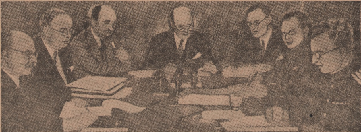
Na zdjęciu Trybunał w chwili opracowywania motywów wyroku, który dziś zostanie wykonany. Siedzą od lewej: prof. de Vabres (Francja), sędzia Parker i Biddle (Ameryka) przewodniczący Trybunału Lawrence i sędzia Birkett (Anglia), mjr. gen. Nikiczenko i plk. Volchkoj (Zw. Radziecki)