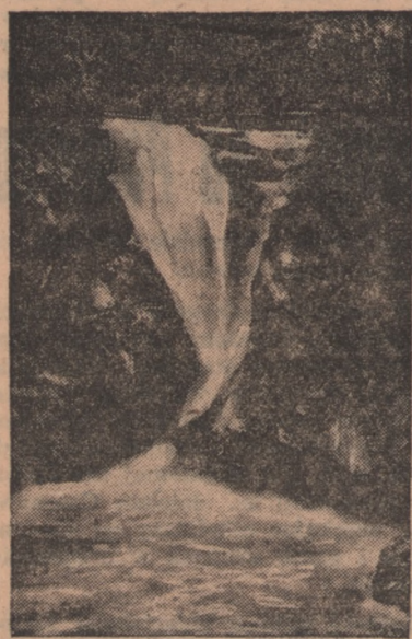
Wodospad Szklarski koło Szklarskiej Poręby

Ale kto raz odwiedzi Toruń, ten już na zawsze zwiąże go w myśli z wianuszką barwnego kwiecia, którą umieści jako godło już dziedziczne, właśnie w jego herbowej tarczy.