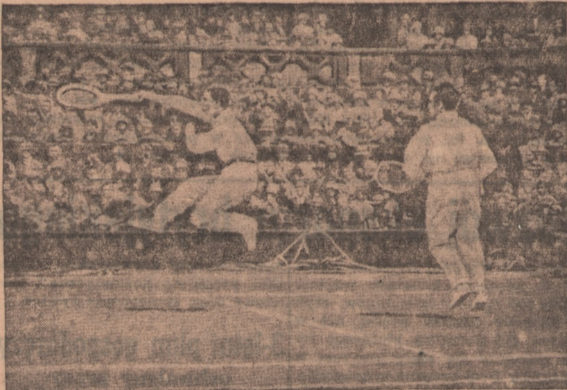
Efektowny skok Brugnon'a, odbijającego wysoką piłkę z woleja.

Brugnon serwowal wspaniale. Pierwszą piłkę uderzał niezwykle silnie i tak celnie ją plasował, że nie rzadko już ona była „kończąca”. Natychmiast po serwisie podbiegał Brugnon do siatki, żeby tu polować na woleja, który był również jego znakomitą specjalnością. W finale mistrzostw Francji w roku 1927 Brugnon zdeprymował zupełnie Lacoste'a lokując swój serw na linii środkowej.