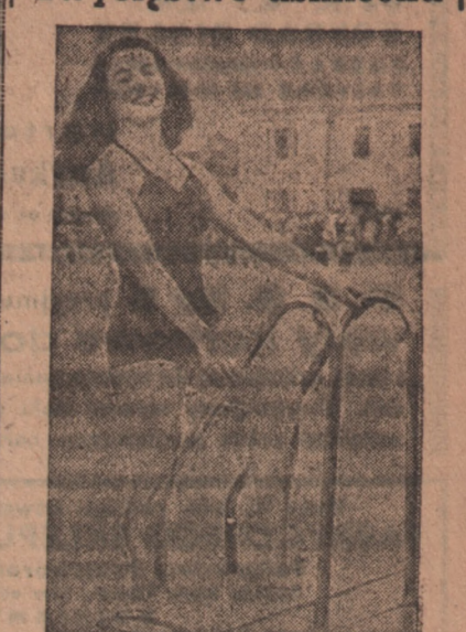
Konkursy piękności cieszą się na Zachodzie wielką popularnością. Miejsca wypoczynkowe są szczególnie dogodnym terenem dla tego rodzaju imprez...