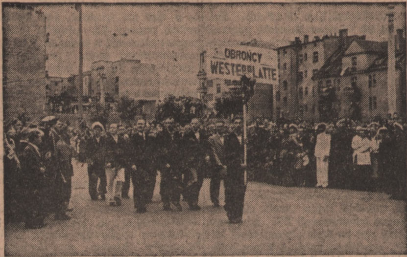
Defilujących przed główną trybuną nielicznych pozostałych przy życiu „obronców Westerplatte” na „Święcie Morza” w Gdyni witała publiczność burzliwymi oklaskami