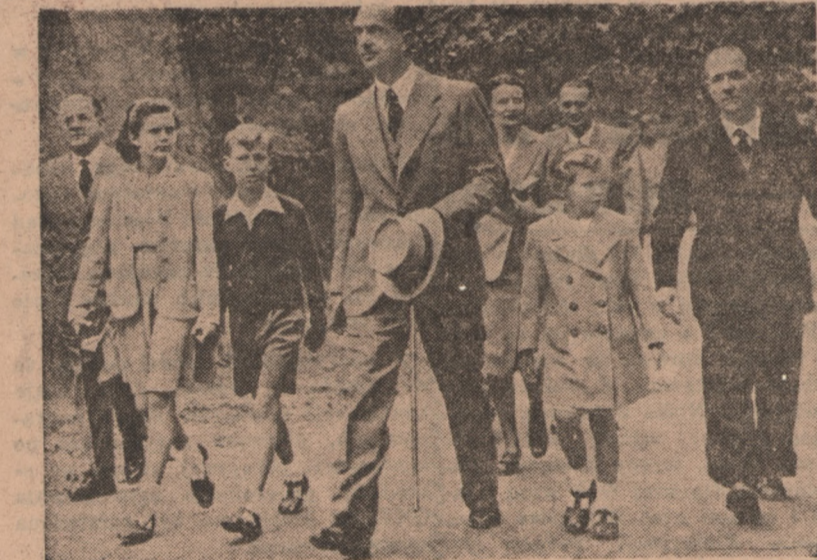
Na zdjęciu Umberto II, b. król włoski wraz z swoimi dziećmi na drodze do kościoła w Cintra.

minister zdecydował się na udzielenie zezwolenia na wolną sprzedaż mięsa w trzech wielkich miastach francuskich.