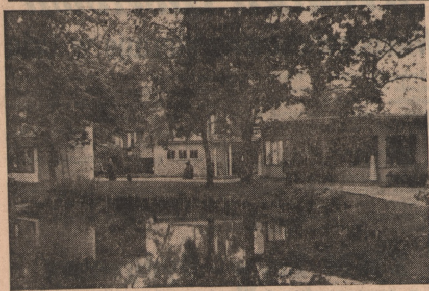
Widok ogólny na Pomorską Wystawę Gospodarczą w Bydgoszczy

jeżeli rząd centralny nie zmieni polityki rządowi Kuo-min-taigu nieprawidłowy rozdział towarów UNRRA.