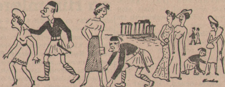
Policjanci Pangalosa w wojnie z elegantkami greckimi...

Przeciwko nowym rządom wybuchła rewolta już po kilku dniach. Rewolte jednak sifumiono. Rząd podał się do dymisji. Nowy rząd rów-