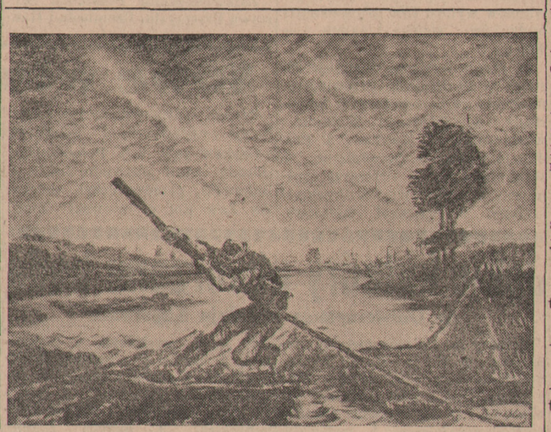
Flisak — Triblera

Popełniliśmy w okresie spontanicznym szereg kardynalnych błędów i wiemy dobrze, że co się zepsuje w ciągu miesiąca, nie można często przez całe lata naprawić. Dopuszciliśmy niebacznie do rzeczy wielkich ludzi nieskończenie małych. Na szczęście zwrotnica jest za nami. Na nowych torach będziemy stosować nowe metody i nowe będą cele, które zamierzamy osiągnąć. Ziemie odzyskane, nasza wizytowa karta w oczach świata stanie się kartą reprezentacyjną i godną narodu, jaki się kryje za drzwiami Śląska, ziemi Lubuskiej i Pomorza.