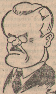
Minister spraw zagr. ZSRR Mołotow

„Proszę przyjąć Panie Premierze wyrazy podziękowania i życzenia w związku z pomyślnym zakończeniem naszych rokowań, które są poważnym wkładem w dzieło przyjaznych stosunków między ZSRR i Iranem. Jestem pewien, że nasze pertraktacje na temat zagadnień gospodarczych i Pański cenny w nich udział, doprowadzą do rezultatów korzystnych dla naszych narodów”.