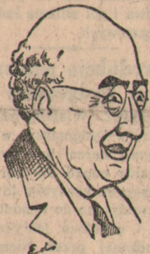
Premier perski Sultaneh

MOSKWA (PAP-G). TASS donosi, że min. spraw zagr. ZSRR, Mo-