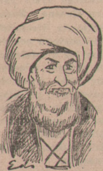
MOHAMED ALI wielkorządca turecki w Egipcie, pokonał powstańców greckich

nictwem którego prowadziło intrygi. Oczywiście najlepiej i najenergiczniej snuła swoje intrygi Anglia, posiadająca w tym względzie bogate doświadczenia, zwłaszcza kolonialne. Anglia umiała,