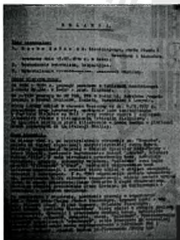
DSC00544.JPG ~769 KB

Uprzejmie informujemy, że Instytut Pamięi Narodowej - KŚZpNP wywiązuje się z przepisów Rozporządzenia PE i Rady (UE) 2016/679 z 27 kwietnia 2016 r. w sprawie ochrony osób fizycznych w związku z przetwarzaniem danych osobowych i w sprawie swobodnego przepływu takich danych oraz uchylenia dyrektywy 95/46/WE (ogólne rozporządzenie o ochronie danych). Administratorem Pani/Pana danych osobowych jest Prezes IPN - KŚZpNP z siedzibą w Warszawie, adres: ul. Wołoska 7, 02-675 Warszawa. Pełna treść klauzuli informacyjnej jest opublikowana na stronie https://ipn.gov.pl/pl/edukacja-1/dla-nauczycieli . W przypadku braku Pani/Pana zgody na otrzymywanie kolejnych maili o podobnej tematyce, należy wysłać odpowiedź na tego maila o treści: "nie wyrażam zgody na dalszą korespondencję ze strony IPN-KŚZpNP".