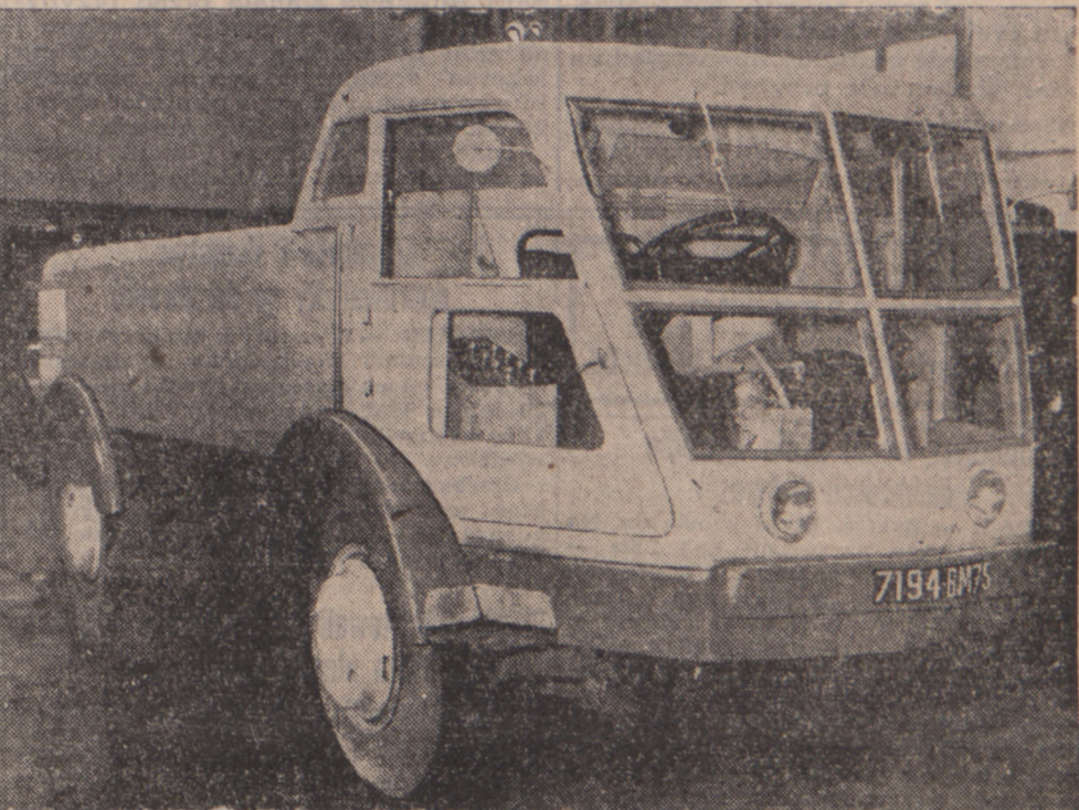
Rada miejska Paryża wprowadziła nowy typ zamiatacza i polewacza ulic. Każdó do wody posiada pojemność 5.500 litrów a zasięg strumienia dochodzi do 40 m. Miotły mają również znacznie szersze pole zasięgu. Ulepszone urządzenie kabiny konduktora usprawnia jego pracę.