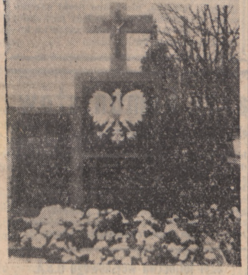
Pomnik ku czci poległych lotników polskich w Charleroi (Belgia), ufundowany przez Zw. Polaków tamtejszego okręgu.