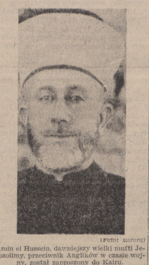
Amin el Hussein, dawniejszy wielki mufti Jerolimy, przeciwnik Anglików w czasie wojny, został zaproszony do Kairu.