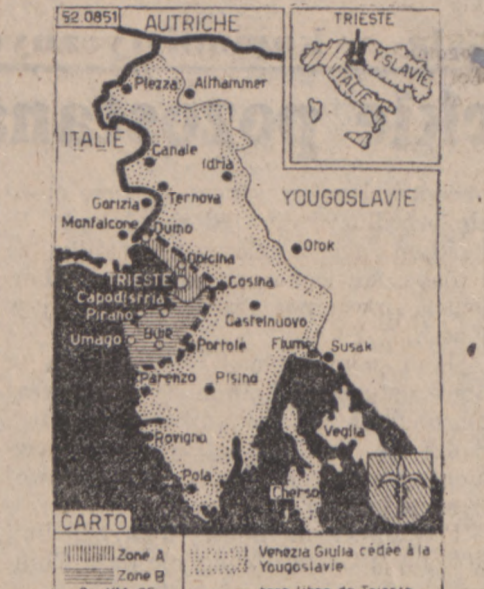
Mapka obszaru Triestu. Na wschodzie i północnym wschodzie Jugosławii znajdują się armie satelitów Rosji...