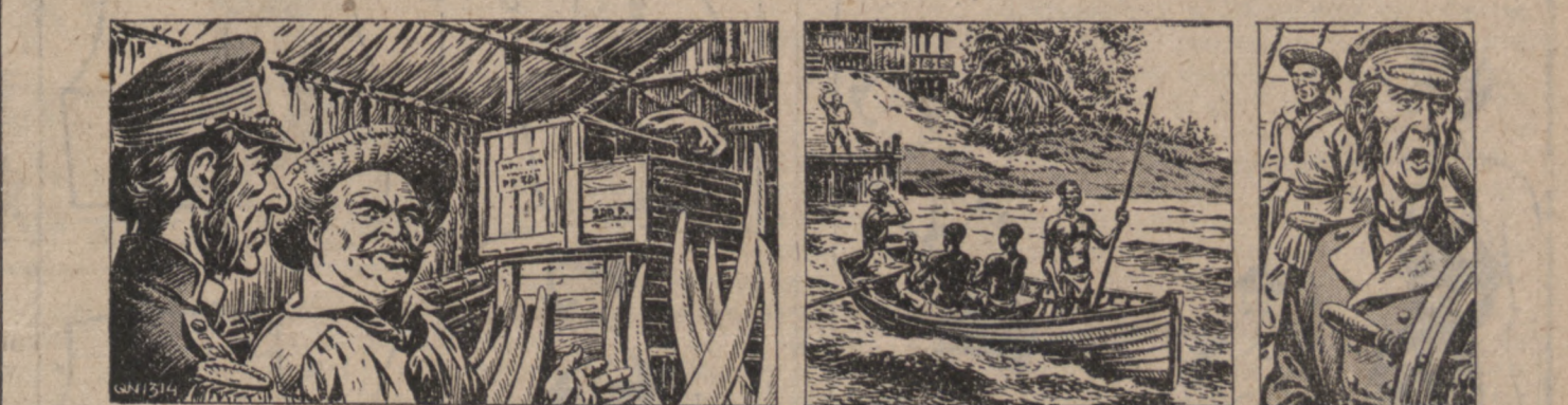
(Ciąg dalszy — Odcinek nr 33)