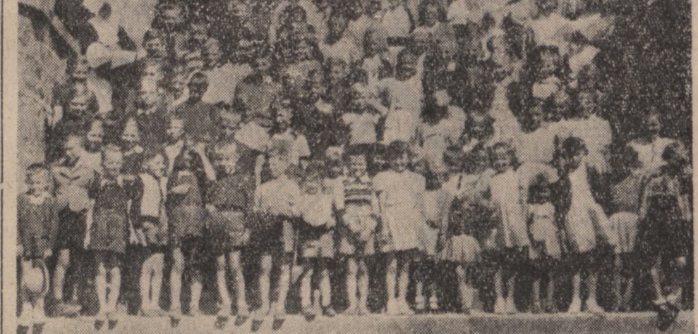
Dzieci z Kolonii Letnich w Chenelette i Les Ardillats przed kościołem w Chenelette.