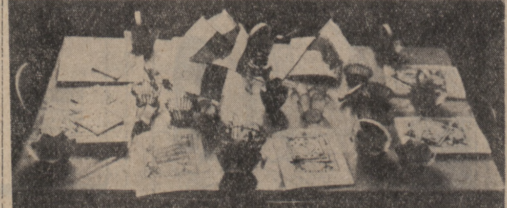
Fragment z wystawy, przedstawiający piękne wyniki pracy dzieci z przedszkola w Gautheretach...