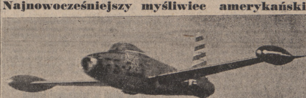
Oto najnowocześniejszy myśliwiec amerykański, „Sky Blazers”, przedstawiony podczas niedawnego pokazu sprzętu lotniczego.

Vertical text on the left margin: ci!, ICH, tom, NIA!, na tego, do i konna, Na- cę- syn- len- cka, ci!, ICH, om, IA!, go, fra- adro- eglo- pod zy do opró- tr. 5 fr. 3, 40 lat, 64 Paul, EMONT, (1681), sważł, D- do- (168), LLIE, w swi- onie e- nale- FILIE, LOM- (1684), H oraz, 02. do, fr. 5 fr. 3, 0 fr. 3, barok- pokój, pra- 20 do, fot., LI, LE, (1689), awia- m, austr- Stefan, - S.A. (1684), pozna- c, celu, r. do, fr. 5 fr. 3, 0 fr. 3, edowe, rancje, ozwo- tracił, r. 12, TRON, LALI- leny, Jurek, Nord), Lens, riera, Litw, LENS