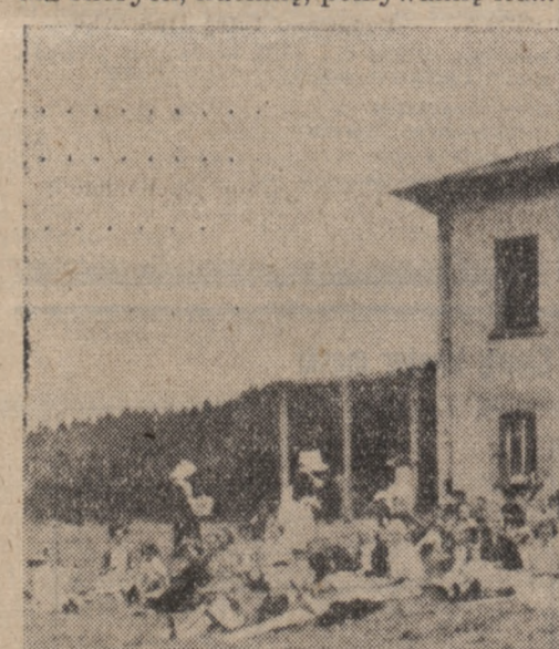
Rzut oka na Kolonię Letnią dla chłopców polskich w Chenelette...