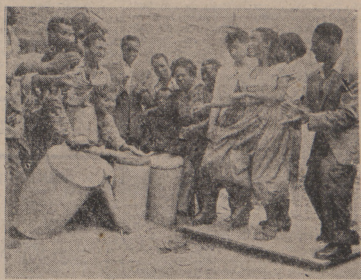
Murzyńscy tancerze i śpiewacy