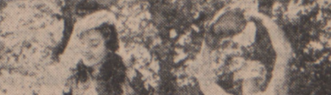
„Armia europejska powinna pić wino”