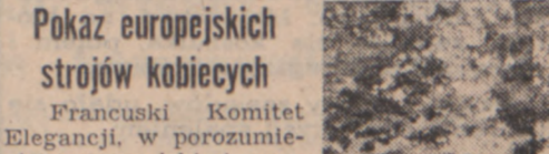
Pokaz europejskich strojów kobiecych

Jego córka woła go do siebie? — Coż to ma znaczenie? Fred Harding wszak dowiedział się, że wyjechała z pewnym młodym mężczyzną. — Zaginęły wszelkie ślady. — Obecnie przyszła telegram? — Na co potrzebny jej jest Fred Harding? — Czy cierpi głód — a nuż bieda dała się jej w znaki? — Może opuścił ją kochanek z którym wyjechała? — Ojciec Döring nie mógł się zdecydować na stanowczy krok. — Jego myślenie starała się przeniknąć istotnie treści otrzymanego telegramu i wyczytać wszystko to, co znajduje się pomiędzy werskami i co nie jest dostępne dla postornego człowieka. — Posłać Fredowi telegram na dworzec, czy nie? — Godzina jest jeszcze wczesna i można zdążyć. — Jest pięć minut do dziesiątej — pojedzie autem, potrwa to jedynie dziesięć minut. — Należy się zdecydować. — Ojciec Döring wstał z miejsca i począł przechadzać się nerwowym krokiem wzdłuż pokoju. — Dziesięć minut. (Ciąg dalszy nastąpi)