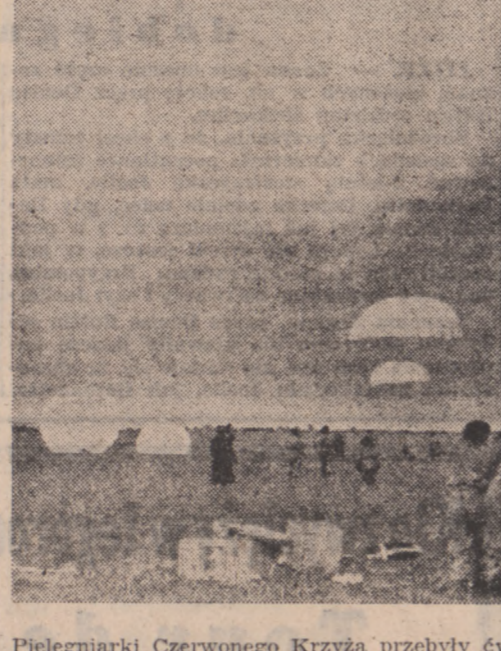
Pielęgniarki Czerwonego Krzyża przybyły ćwiczenia ratownicze...