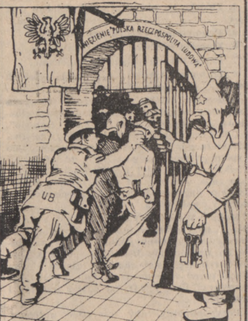
ART. 1. PUNKT 2. KONSTITUCJI: W POLSCE WŁADZĄ MA WŁADZA NADTĘŻY