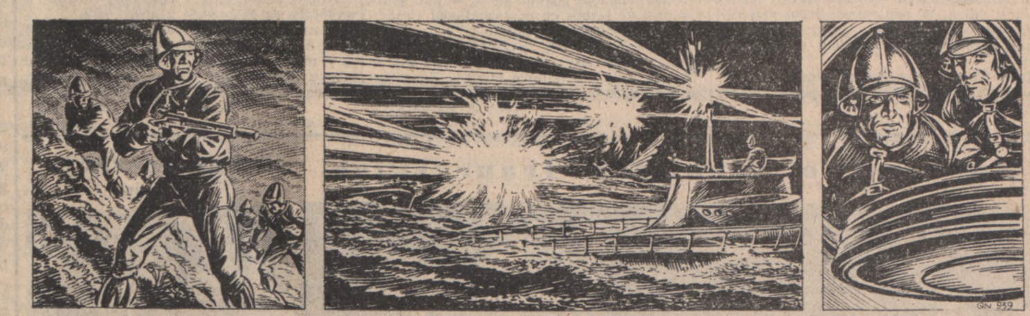
(Ciąg dalszy — Odcinek nr. 54)