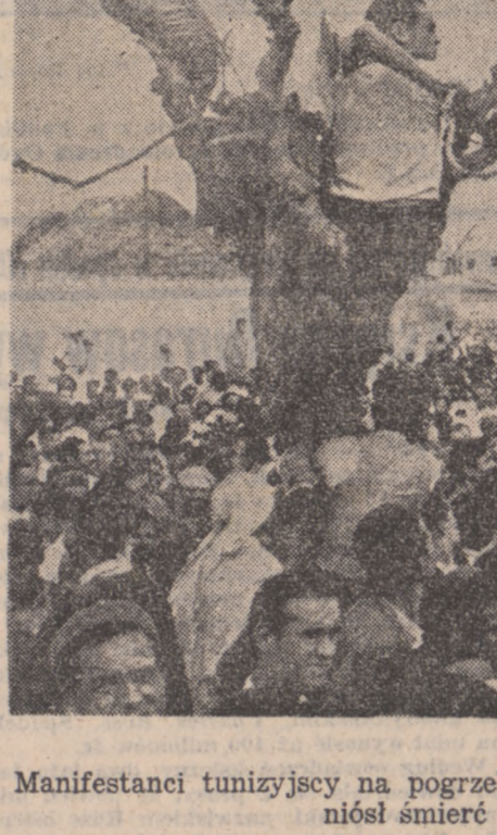
Manifestanci tunijscy na pogrzebie jednego z demonstrantów, który poniósł śmierć w czasie zaburzeń.