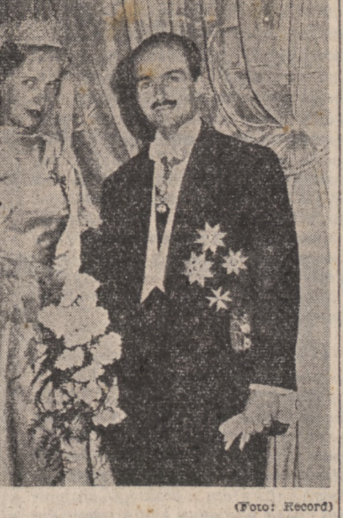
Arcyksiążę Otto Habsburski z małżonką, wspaniałe orszak weselny. Za miejsca na balkonach płacono do 10 tys. fr.