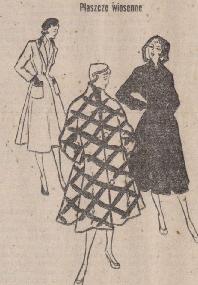
Wiosenne plaszcze mają różne kroje, z których można wybierać wedle upodobania. Są obcisłe, proste lub szerokie, zadowolając wszystkie gusty.