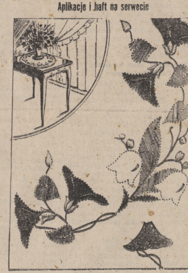
Ładne przybranie serwety na stół stanowi wianek kwiatów aplikowanych. Kwiaty wycięte z różnokolorowych kawałków płótna. — Lisiec są wycięte z zielonego materiału, lodgi wyhaftowane zieloną bawełną, konwale białą bawełną.