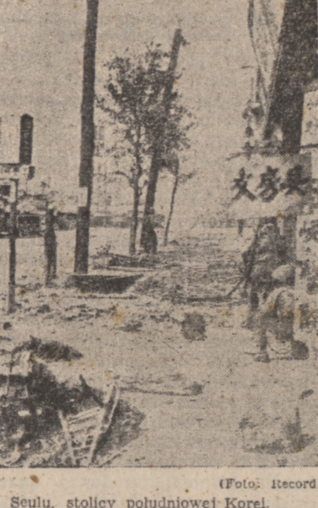
Zniszczona ulica Seulu, stolicy południowej Korei.