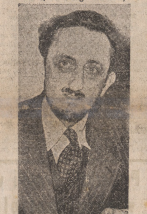
P. Francis Perrin, nowy Wysoki Komisarz dla spraw Energii Atomowej.

PARYZ. — Dekretem, ogłoszonym w „Journal Official” p. Francis Perrin został mianowany wysokim komisarzem dla spraw energii atomowej.