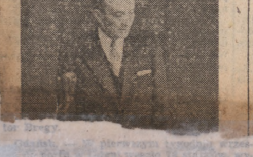
Prezydent Auriol w Marsylii: „Francja odrzuca wszelką myśl o nowej wojnie”

Przemawiając w Ratuszu, prezydent Auriol oświadczył, że Francja odrzuca wszelką myśl o nowej wojnie. Wezwał Francuzów do zjednoczenia się, by głos Francji zawył zjednoczenia się, by głos Francji zawył zjednoczenia się.