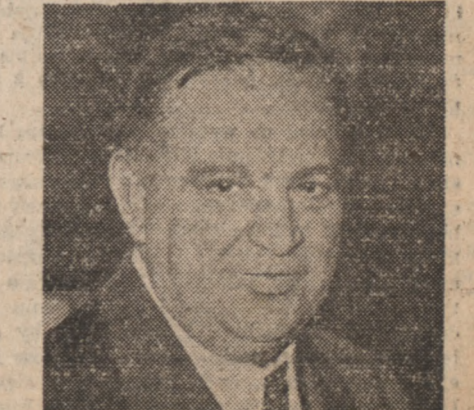
Fiorello La Guardia La Guardia był bardzo popularnym nie tylko w Nowym Jorku, ale w całym Stanach Zjednoczonych.

NOWY JORK. — Były burmistrz Nowego Jorku i były dyrektor UNRRA, Fiorello La Guardia, zmarł po dłuższej chorobie w 65-tych roku życia. Główną chorobą La Guardia dawała się od czerwca, od czasu operacji. Od ubiegłego wtorku zmarły rzadko kiedy wracał do przytomności i lekarze stracili nadzieję na utrzymanie go przy życiu.