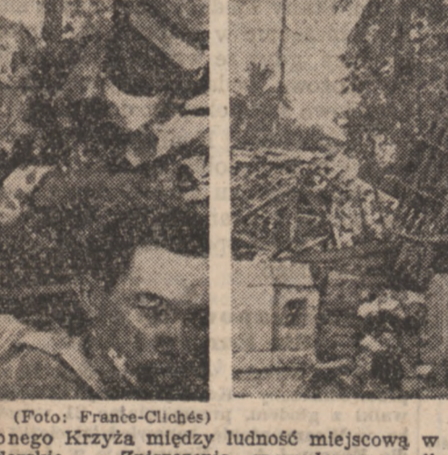
Rozdzielanie pomocy holenderskiego Czerwonego Krzyża między ludność miejscową w okolicy Padangu, po zajęciu miejscowości przez wojska holenderskie. — Zniszczenia, spowodowane walkami w Tizkampek.