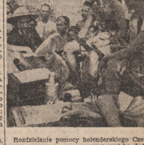
Rozdzielanie pomocy holenderskiego Czerwonego Krzyża między ludność miejscową w okolicy Padangu, po zajęciu miejscowości przez wojska holenderskie. — Zniszczenia, spowodowane walkami w Tizkampek.