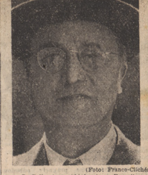
P. Bollaert, wicekomisarz Francji w Indochinach.