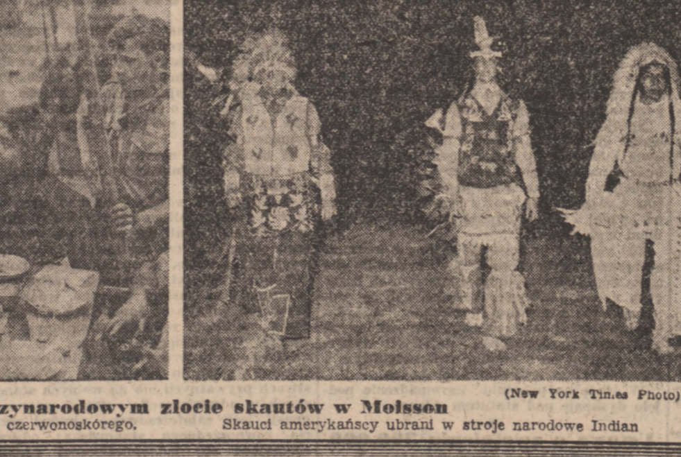
Na międzynarodowym zlocie skautów w Molssan. Skaut amerykański ubrany w stroje narodowe Indian