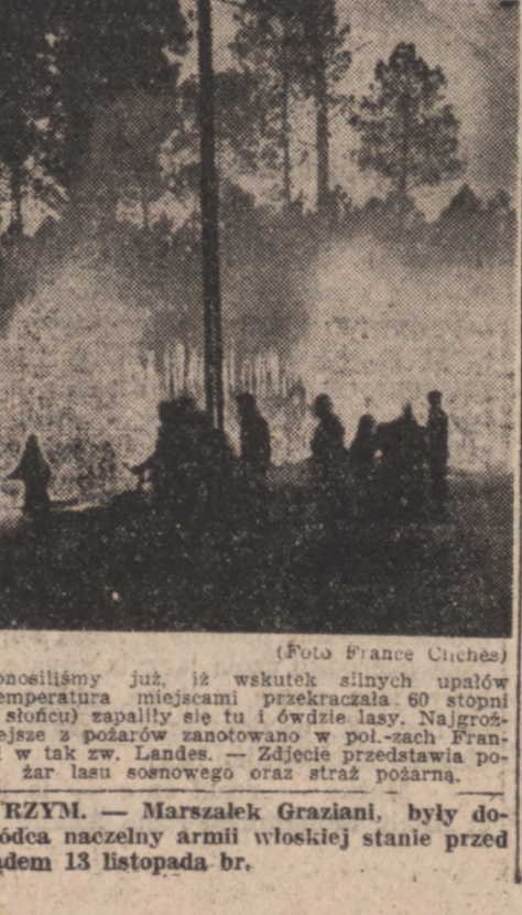
Donosiłmy już, iż wskutek silnych upałów (temperatura miejscami przekroczyła 40 stopni w słońcu) spaliły się tu i ówdzie lasy. Najgroźniejsze z pożarów zanotowano w poł-zach Francji w tak zw. Landes — Zielony przedstawia pożar lasu sosnowego oraz straż pożarną.