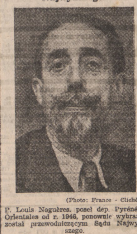
P. Louis Nogueres, poseł dep. Pyrénées Orientales o r. 1946, ponownie wybrany został przewodniczącym Sądu Najwyższego.