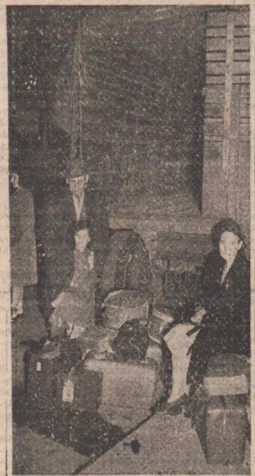
Turyści angielscy, zaskoczeni strajkiem, przed ambasadą brytyjską, która prosiła o pomoc.

Na pierwszy rzut oka wydawało się, że Paryż podczas strajku był tym samym wielkim zborowiskiem ludzi, co przed strajkiem. Po hałaśliwych ulicach przeważały się masy samochodów, sidery były nadal obficie zaopatrzone, chleba tak samo nielatwo było dostać, jak przed parą tygodniami, mięsa w dalszym ciągu nie widać.