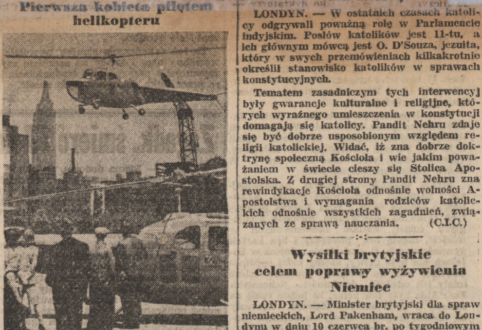
Amerykanka, 23-letnia panna Shaw jest pierwszym pilotem helikoptera w świecie.