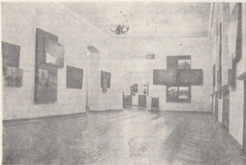
„Ochrona zabytków architektury w województwie toruńskim” — wystawa w gmachu głównym