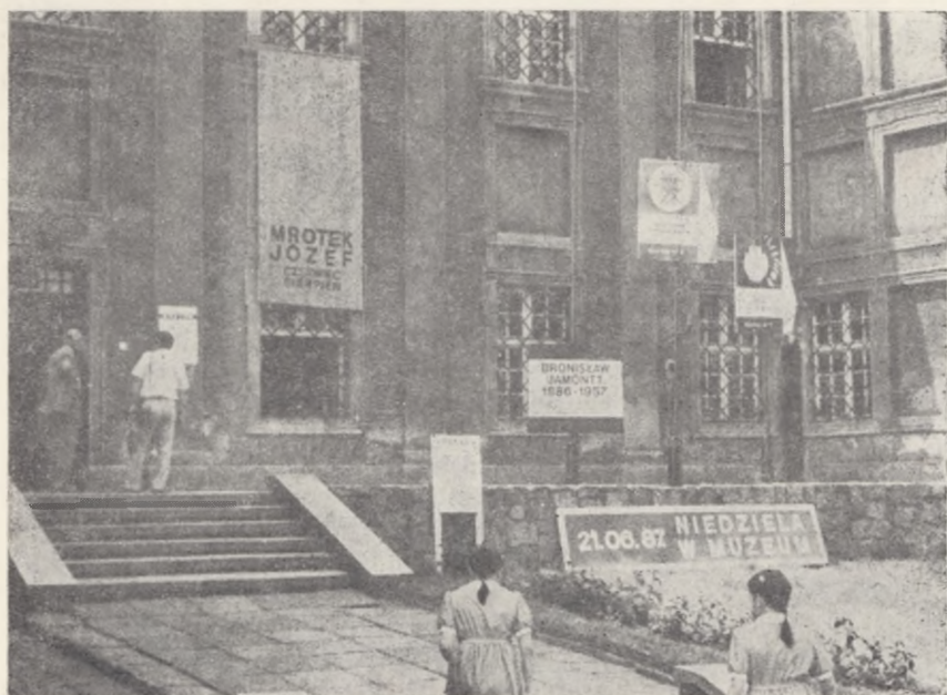
„Niedziela w Muzeum” — fronton gmachu głównego w dniu 21 czerwca 1987 r.