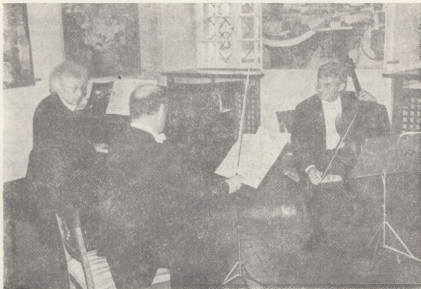
Zespół kameralny „Trio Göbel Berlin” podczas koncertu w salach Muzeum