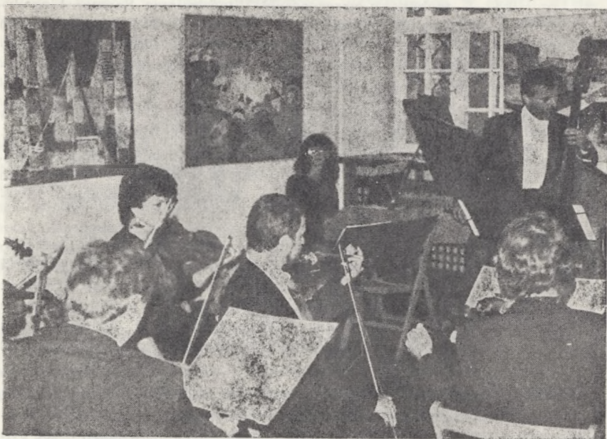
Festiwalowy koncert warszawskiego zespołu „Concerto Avenna” w grudziądzkim Muzeum

utwory J. S. Bacha i W. F. Bacha oraz W. A. Mozarta. Frekwencja: 220 osób;