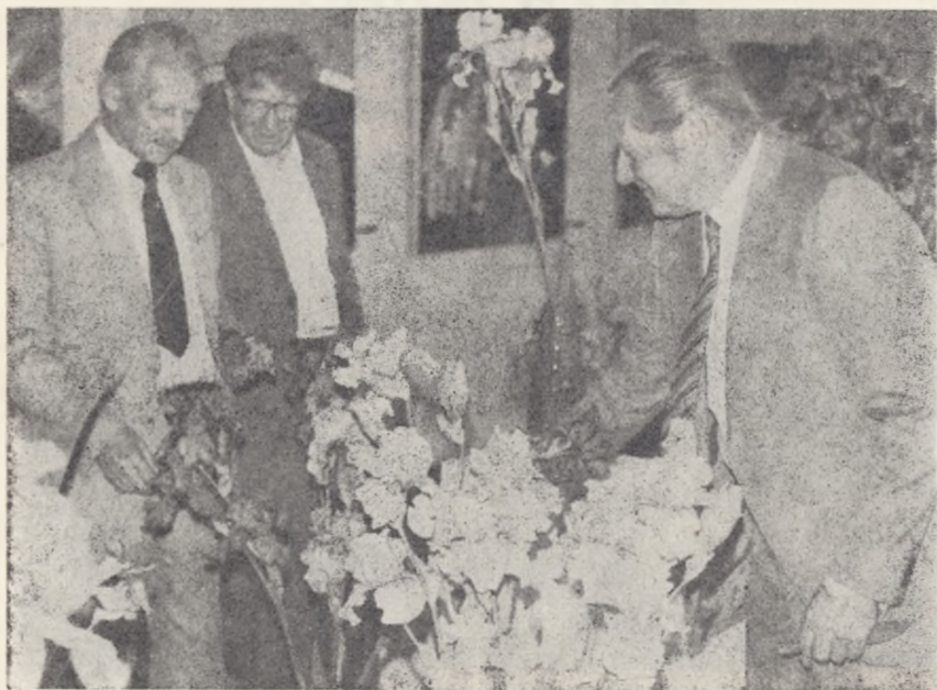
Organizatorzy wystawy irysów podczas przygotowywania ekspozycji w salach Muzeum