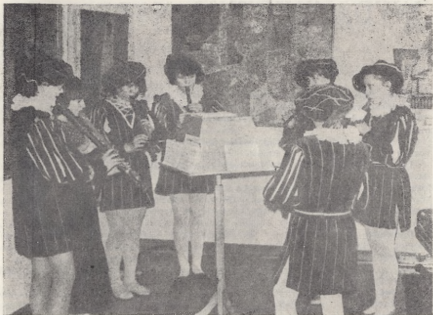
Występ „Piszczków Grudziądzkich” podczas „Niedzieli w Muzeum”