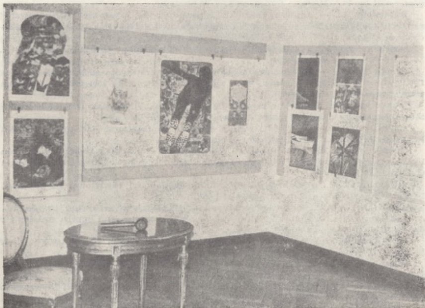
Fragment sali z wystawionymi grafikami przeznaczonymi na aukcję podczas „Niedzieli w Muzeum”