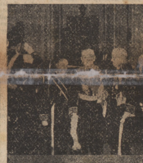
Nowy ambasador Francji przy Watykanie, p. Wladimir d'Ormesson...