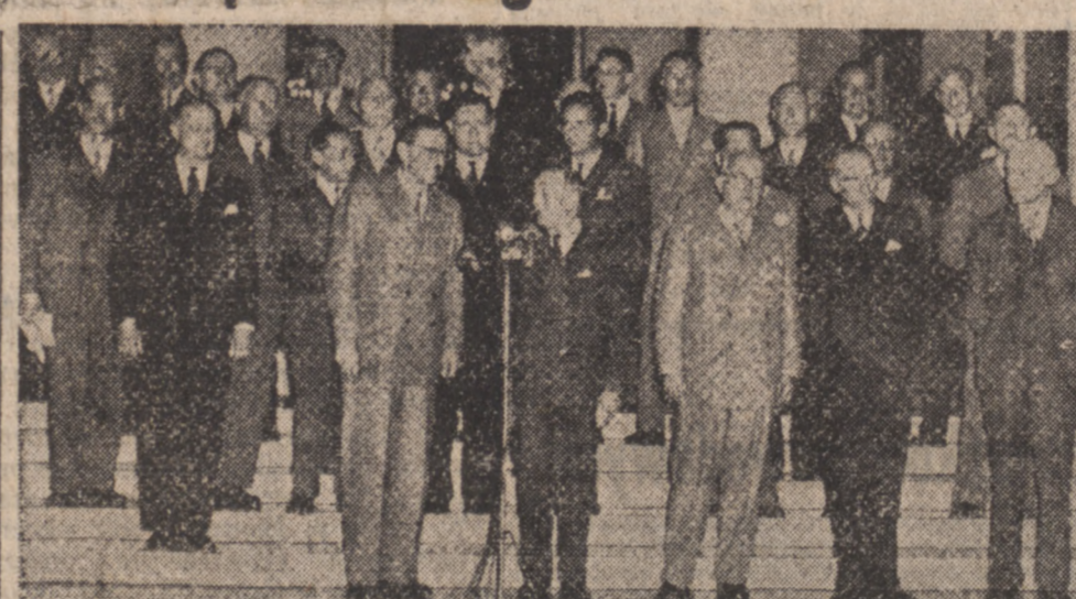
Nowy rząd francuski. Stoją w pierwszym rzędzie od prawej ku lewej: Jules Moch, min. spraw wewnętrznych, premier i min. finansów Queuille, prezydent V. Auriol, wicepremier i min. spraw zagranicznych Robert Schuman.

PARYŻ. — W niedzielę po południu odbyło się pierwsze posiedzenie nowego rządu. Postanowiono, że ze względu na pilność prac rządu, ministrowie nie będą wyjeżdżać na żadne uroczystości do 1 listopada. Sprawy gospodarcze i finansowe były głównym przedmiotem obrad. We wtorek po południu, po ostatnim posiedzeniu gabinetu, przedstawili się Zgromadzeniu Narodowemu. W debacie nad składem exy polityka rządu — jak zapewniają — nie należy spodziewać się żadnej niespodzianki. Gabinet premiera Queuille, opierający się na grupach od socjalistycznej aż do PRL włącznie, ma zapewnić większość. Pierwsze projekty finansowe i gospodarcze zostaną opracowane na środowym posiedzeniu rady ministrów i w czwartek przekazane Zgromadzeniu Narodowemu, które zajmie się nimi jeszcze w bieżącym tygodniu.