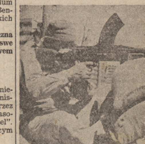
Strzelec Haganah na posterunku w Palestynie.

Tel - Aviv. — W poniedziałek doniesiono, iż 78-letni przywódca Syjonistów Weizmann, został wybrany przez żydowską Radę Narodową tymczasowym Prezydentem państwa „Izrael”. Był on wieloletnim przewodniczącym Światowego Związku Syjonistów.