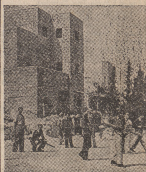
Patrol żydowski w jerozolimskiej dzielnicy Katanon.