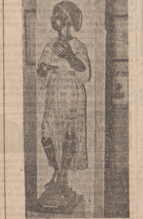
Wśród ekspozycji na wystawie stulecia zniesienia niewolnictwa w muzeum Francji zamorskiej widnieje posąg wykonany w r. 1794 i przedstawiający uwolnioną murzynkę z czepkami tryfrygijskimi na głowie