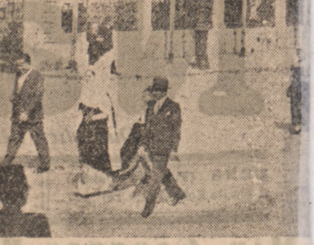
Cała tradycyjnego pochodu, który przeszedł w drodze z kolei defiladzie wojennej uczestniczyło 5.000 uczniów szkół wojskowych...

W krótkim przemówieniu wyraził ufność w czynność żołnierzy i zdolność do obrony Francji i wolnych instytucji republikańskich.