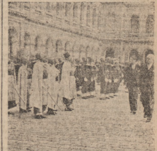
Hiszpani i strzelcy oddają honory prezydentowi Vincent Auriołowi...