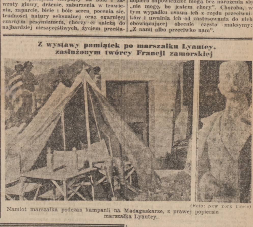
Namiot marszałka podczas kampanii na Madagaskarze, z prawej popiersie marszałka Lyautey.

Wystawy pamiątek po marszałku Lyautey, zasłużonym twórcy Francji zamorskiej