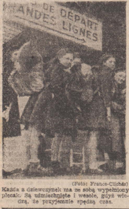
Każda z dziewczynek ma za sobą wypełniony plecak. Są uśmiechające i wesole, gdyż wiedzą, że przyjemnie spędzą czas.