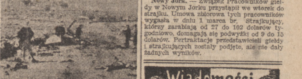
Zwłoki żydów, sabyliwych w starciu z Arabami na południe od Bejrutu.

Arabami, po drugie domagał się zwolnienia Nadzwyczajnego Zebrania O.N. Z. w sprawie ponownego rozpatrzenia zagadnienia palestyńskiego. Zakaz wywozu broni na Bliski Wschód Waszyngton. — Amerykański Departament Stanu oświadczył we wtorek, iż Stanu Zjednoczone nie będą wysyłać broni i materiałów wojennych do państw arabskich na Bliskim Wschodzie bez specjalnego zezwolenia amerykańskiego Departamentu Obrony Narodowej.