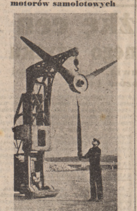
Po każdym 1.000 godzinach lotu, motory aparatów Air-France są poddawane dokładnej rewizji...