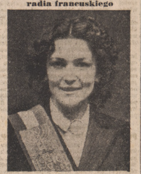
Młoda Paryżanka, która w tych dniach została wybrana „Madelon” radia paryskiego.

Dwóch korespondentów brytyjskich nie otrzymało wiz czeskiej Praga. — Władze czeskie przystąpiły do stosowania różnych trudności wobec korespondentów zagranicznych, którzy przebywali w Czechosłowacji i wylechali w kilka dni po zamachu stanu. Dwóch brytyjskich korespondentów np. nie uzyskało wiz powrotnych. Wśród nich znajduje się korespondent „Daily Herald”.