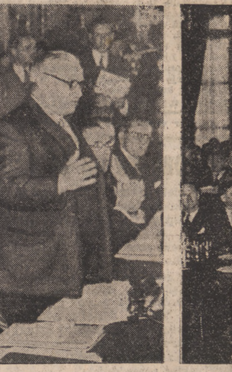
Francuski min. Spraw Zagr., Georges Bidault, wygłasza przemówienie na inauguracyjnej sesji konferencji szesnastu państw.