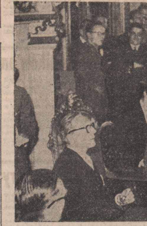
Przewodniczący Konferencji, Ernest Bevin przemawia.