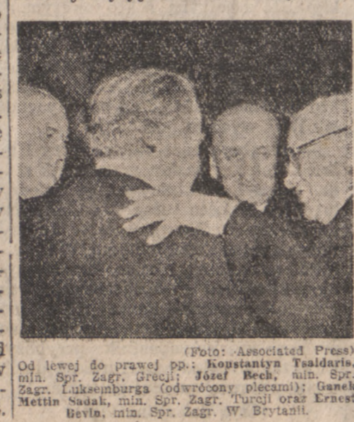
Od lewej do prawej ppł. Konstantyn Talski...