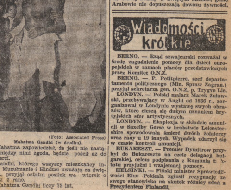
Mahatma Gandhi (w środku). Mahatma zapowiedział, że jeśli nie nastąpi między nimi zgoda, będzie pościł aż do śmierci.

Odpowiadając, jakie jest stanowisko Ameryki wobec propozycji brytyjskich w sprawie zwolnienia ponowne konferencji 16 państw dla przestudiowania planu Marshalla, Lovett powiedział, iż rząd amerykański wychodzi z założenia, iż nie jest jeszcze czas na omawianie warunków planu Marshalla, dopóki Kongres nie zajmie jasnego stanowiska i nie poweźmie dalszych postanowień. Zdaniem Lovetta proponowana Konferencja 16 państw należy odłożyć na czas późniejszy.