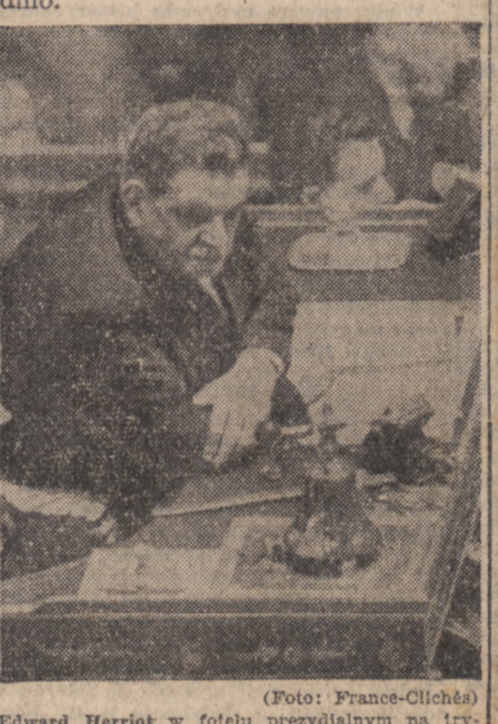
Edward Herriot w fotelu przysiężalnym na trybunie Zgromadzenia Narodowego.

W toku obrad doszło do burzliwych scen. Komunistki domagali się tych samych stanowisk, jakie mieli poprzednio.