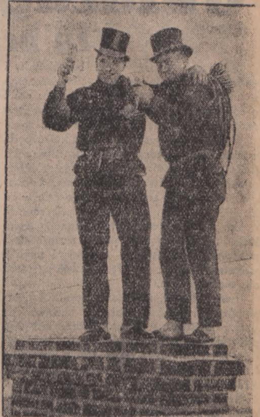
Życzą radosne twarze kominiarzy... A wiadomo, kto ich spotka, może być pewnym, że będzie miał szczęście.